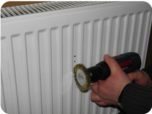
3. Atzīmētajās vietās tiek noņemts...