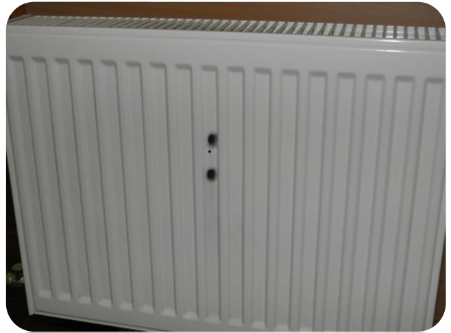
4. ... radiatora krāsojums.