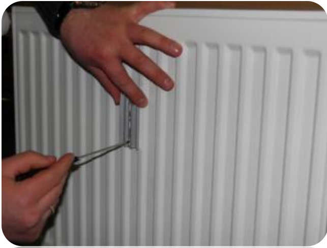
1. Katrs radiators tiek nomērīts un...