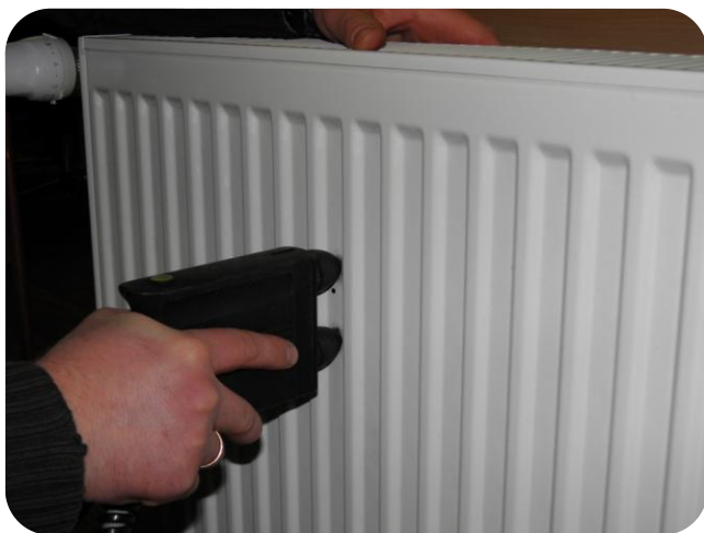
5. Šajās vietās ar speciālu iekārtu...