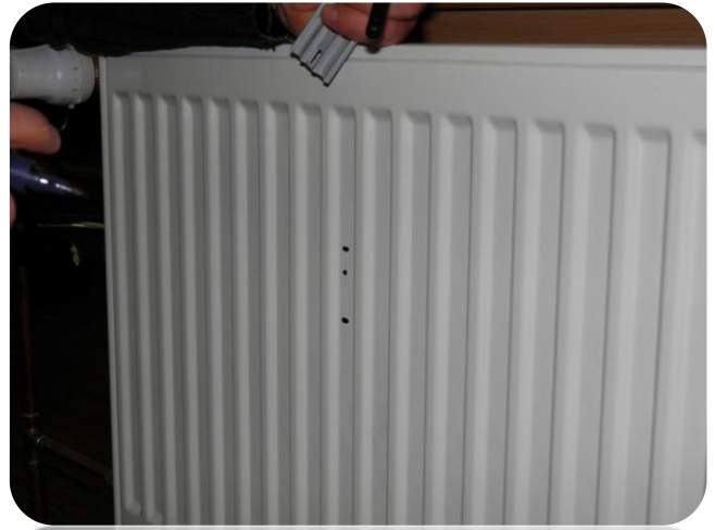
2. ... uz tā tiek atzīmēta montāžas vieta.